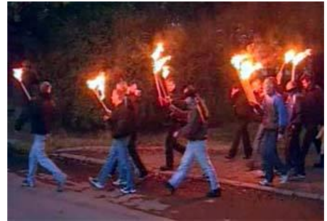
Скинхеды. Факельное шествие в Петербурге.