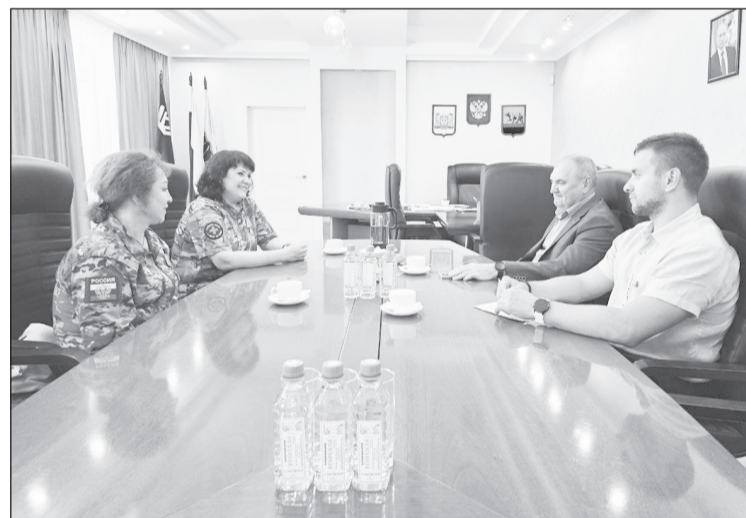
Жительницы Нефтеюганска служат в медицинской ротепочти два года

Напомним, Ханты-Мансийский автономный округ, кроме финансовой, осуществляет также и материально-техническую поддержку своих контрактников. По запросу командира части, в которой служат югорчане, приобретается и передается к месту несения службы специализированное оборудование, необходимое военнослужащим. За неделю в правительство региона приходит до 40 заявок от бойцов, за месяц - более 200.