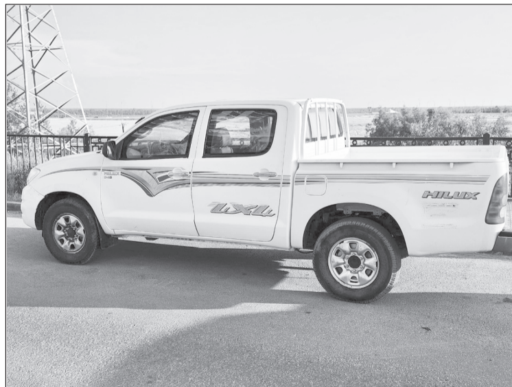
А из Сургута в зону проведения специальной военной операции отправили бронированный внедорожник по просьбе бойца с позывным "Цыган"

- Вместе с коллегами стараемся в максимально сжатые сроки их отработать и обеспечить всем необходимым наших отважных воинов. Мы гордимся мужеством и стойкостью наших защитников и будем продолжать оказывать им всестороннюю поддержку для достижения целей и задач