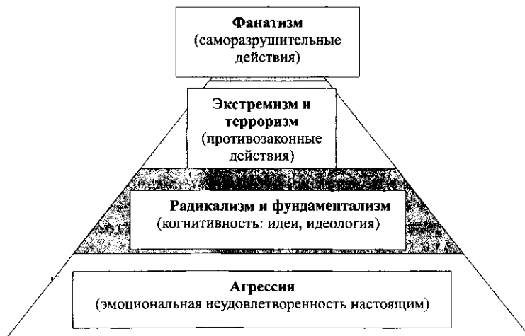
Рис. 3. Модель «Ступени интолерантности»

Перечисленные ступени иллюстрирует ниже приведенная схема.