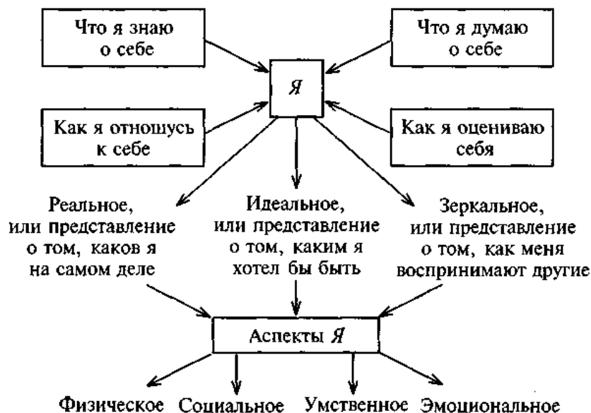
Рис. 2. Структура Я-концепции

ее характерные особенности. Схематически структуру Я-концепции можно изобразить следующим образом (рис. 2):